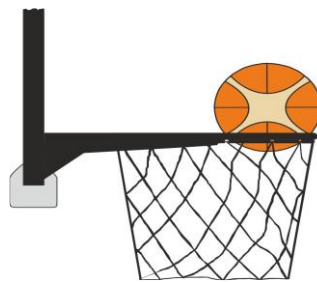
Διάγραμμα 4. Μπάλα μέσα στο καλάθι

31-24 Κατάσταση Είναι παράβαση παρέμβασης (basket interference) εάν ένας αμυνόμενος παίκτης αγγίζει τη μπάλα ενώ η μπάλα είναι μέσα στο καλάθι.