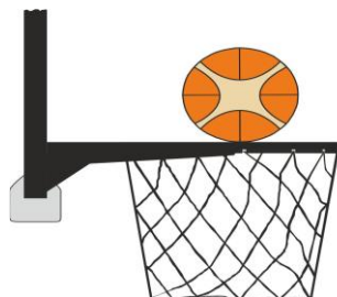
Διάγραμμα 3. Η μπάλα είναι σε επαφή με τη στεφάνη

31-19 Κατάσταση: Η παράβαση παρέμβασης (basket interference) σημειώνεται από έναν αμυνόμενο ή επιτιθέμενο παίκτη κατά τη διάρκεια μιας προσπάθειας για καλάθι όταν ένας παίκτης αγγίζει το καλάθι ή το ταμπλό ενώ η μπάλα είναι σε επαφή με τη στεφάνη και έχει ακόμα τη δυνατότητα να εισέλθει στο καλάθι.