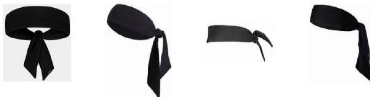
Διάγραμμα1. Παραδείγματα κορδελών κεφαλής

4-4 Κατάσταση. Το να φορούν (οι αθλητές) κορδέλες τύπου φουλάρι, δεν επιτρέπεται.